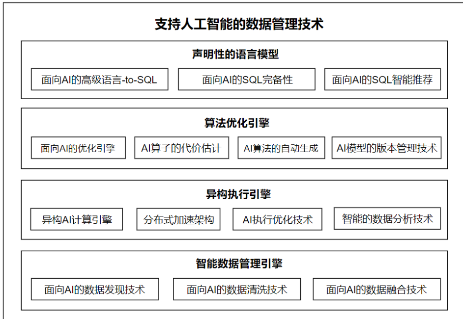
图 2 面向人工智能的数据管理技术